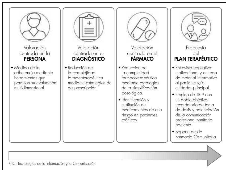
Figura 2. Adaptación del Modelo de Prescripción Centrado en la Persona para mejorar la adherencia terapéutica.

te a la aplicación de estrategias de desprescripción (valoración centrada en el diagnóstico) y en menor medida a estrategias de simplificación posológica (valoración centrada en el fármaco). De este modo, se conseguiría una disminución de la complejidad terapéutica superior a 10 puntos según el índice MRCI . Esta variación es clínicamente relevante si nos basamos en el trabajo de Wimmer y cols. 26 en el que aumentos de 10 unidades en la complejidad farmacoterapéutica se asociaron con una mayor mortalidad [HR 1,12 (IC 95% 1,01 a 1,25)].