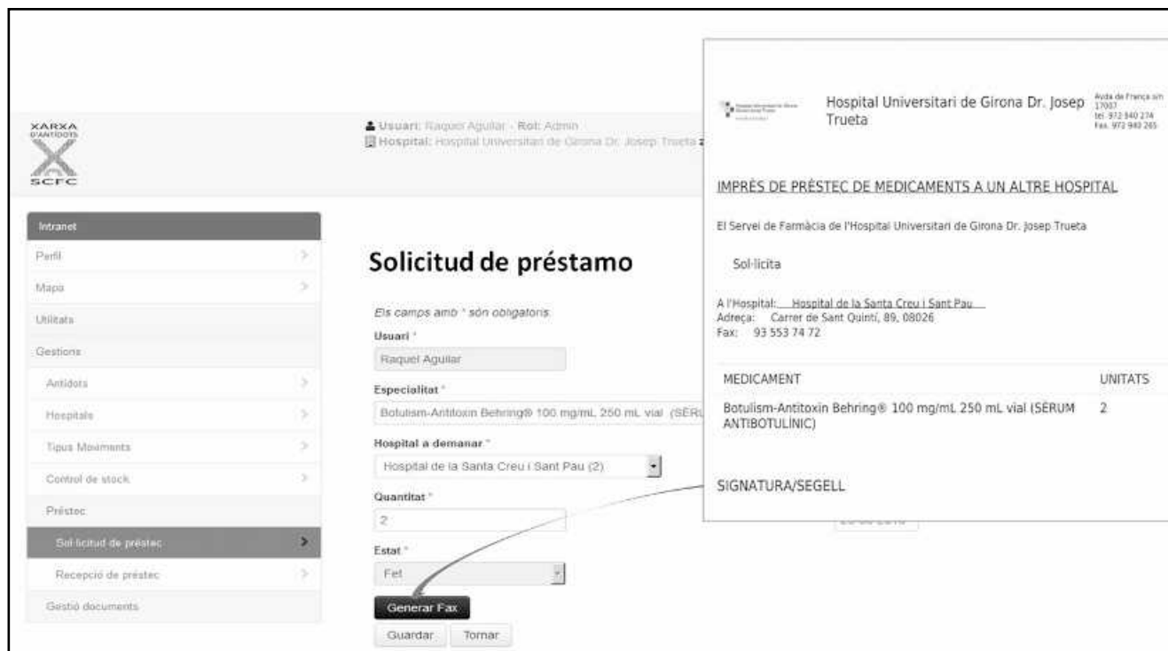
Figure 5. Example of application for loan through the application.

times, and nine loans between hospitals have been conducted. In two cases, these were due to poisoning by Amanita phalloides affecting various members of the same family, where the hospitals only had silibinin available for the first hours of treatment, and therefo-